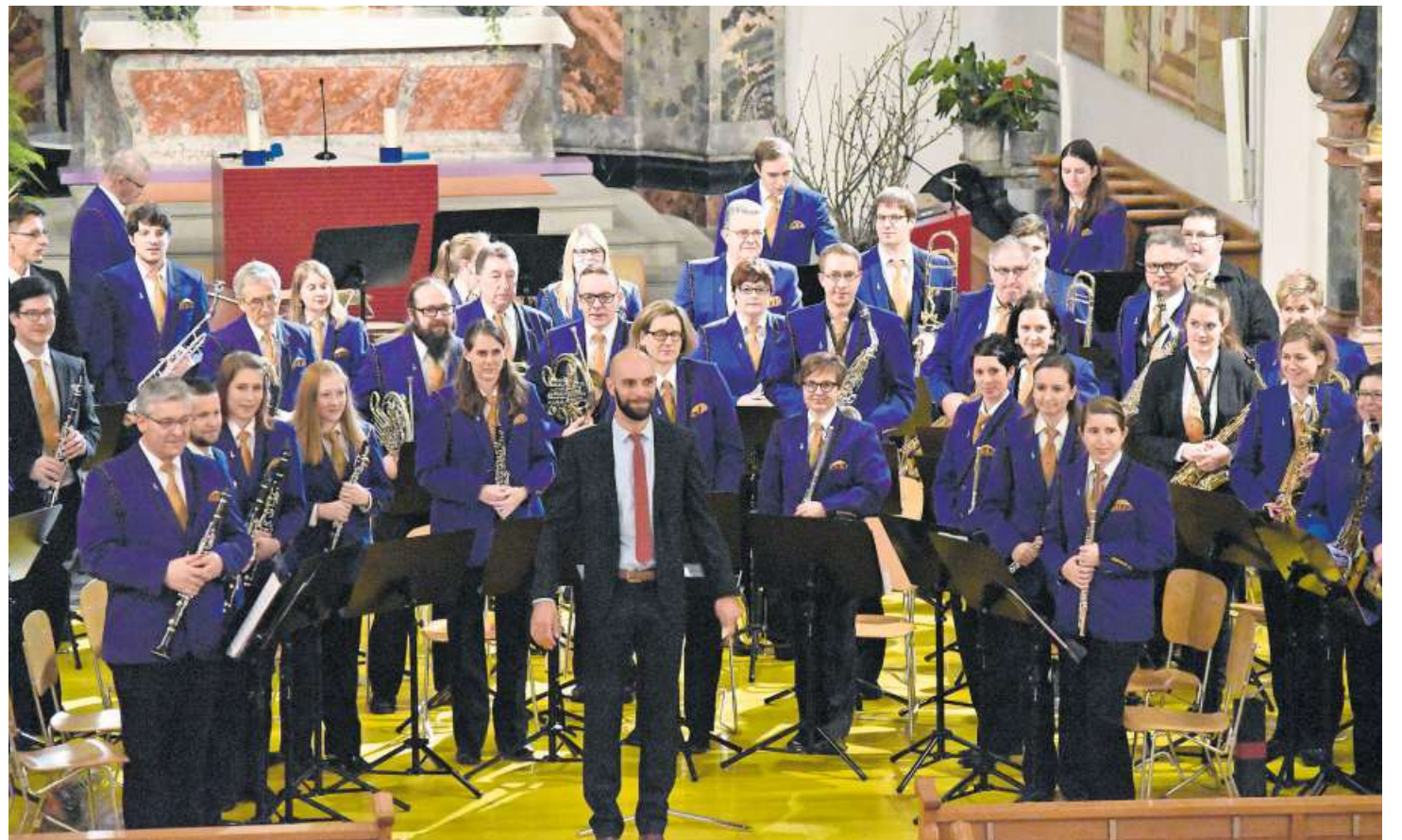
Nicht nur klanglich beeindruckend: die Feldmusik Baar bei ihrem Auftritt in St. Martin.

Danach holte die Feldmusik Baar ihre Zuhörerinnen und Zu-